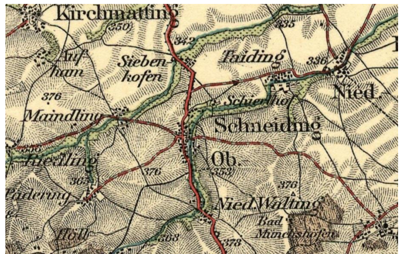
Historische Karte 1916

Das Gebiet um Oberschneiding war bereits vor über 7.000 Jahren besiedelt. Neben dem fruchtbaren Boden waren es wahrscheinlich die Überschaubarkeit der Umgebung und die Nähe zum Wasser des Irlbaches, die die Menschen der Jungsteinzeit dazu bewog, sich hier niederzulassen. Eine erste urkundliche Erwähnung stammt aus dem Jahr 790 in einem Güterverzeichnis des Klosters Niederalteich und wurde dort „Snudinga“ genannt. Von 1319 bis 1801 war Oberschneiding eine offene Hofmark, Sitz war Hienhart. 1802 entstand das Patrimonialgericht Oberschneiding, Sitz ebenfalls in Hienhart. Im Zuge der Verwaltungsreformen in Bayern entstand mit dem Gemeindeedikt von 1818 die Gemeinde. Im Revolutionsjahr 1848 wurde das Patrimonialgericht aufgelöst. Die heutige Gemeinde entstand durch Gebietsreform in den Jahren 1972 und 1978. Heute umfasst sie 34 Ortsteile. Der Ort Oberschneiding selbst zählte 1961 ca. 520 Einwohner, bis 2017 waren es dann ca. 1.200 Einwohner.